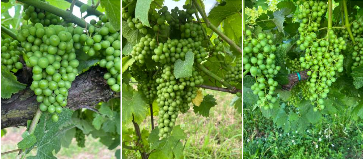
A sinistra Pinot Bianco a torre de roveri, in centro Pinot Grigio a Costa di Mezzate con chiusura grappolo. A destra Merlot in pre chiusura grappolo ad Almenno San Salvatore. Foto scattate il 01-07-2024

Cultivar tardive (Cabernet S.) acino della dimensione di un pisello - pre chiusura grappolo (BBCH 75-77)