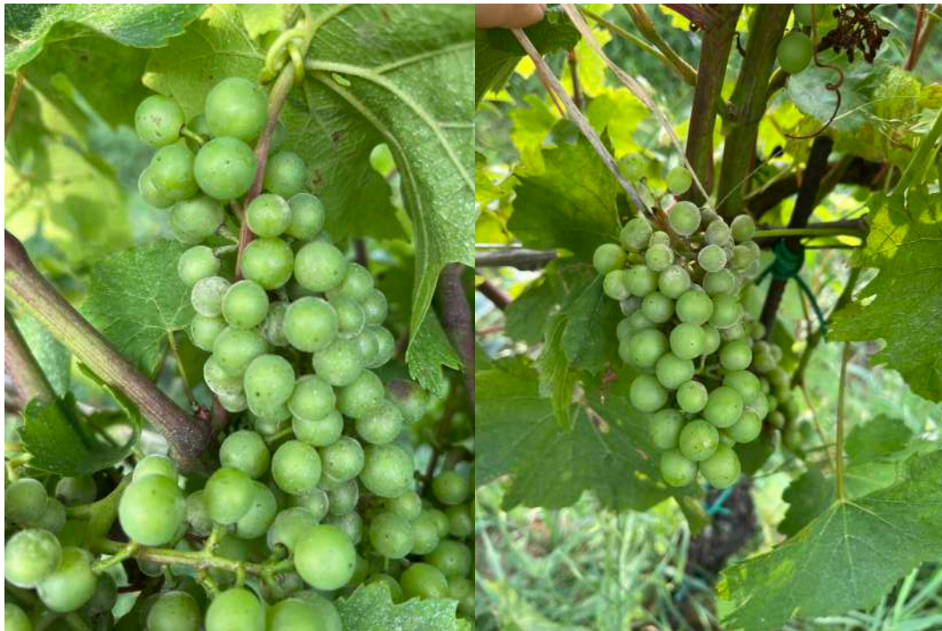
Attacchi di oidio su grappolo di chardonnay. Nelle aree particolarmente predisponenti all'insorgenza del patogeno si notano i primi attacchi al grappolo. Foto scattate il 1-7-2024

Dove la vegetazione è sufficientemente sviluppata si consiglia di intervenire con un trattamento a base di zolfo bagnabile alla dose di 3-4kg/ha. In previsione di piogge abbondanti o di periodi relativamente lunghi con alta probabilità di precipitazione si consiglia di utilizzare prodotti autorizzati in biologico additivati di adesivante per migliorare la persistenza del prodotto sugli organi vegetali. Possono essere eventualmente utilizzati prodotti a base di COS-OGA, oppure di estratti di Laminaria che svolgono un'azione di induttori di resistenza.