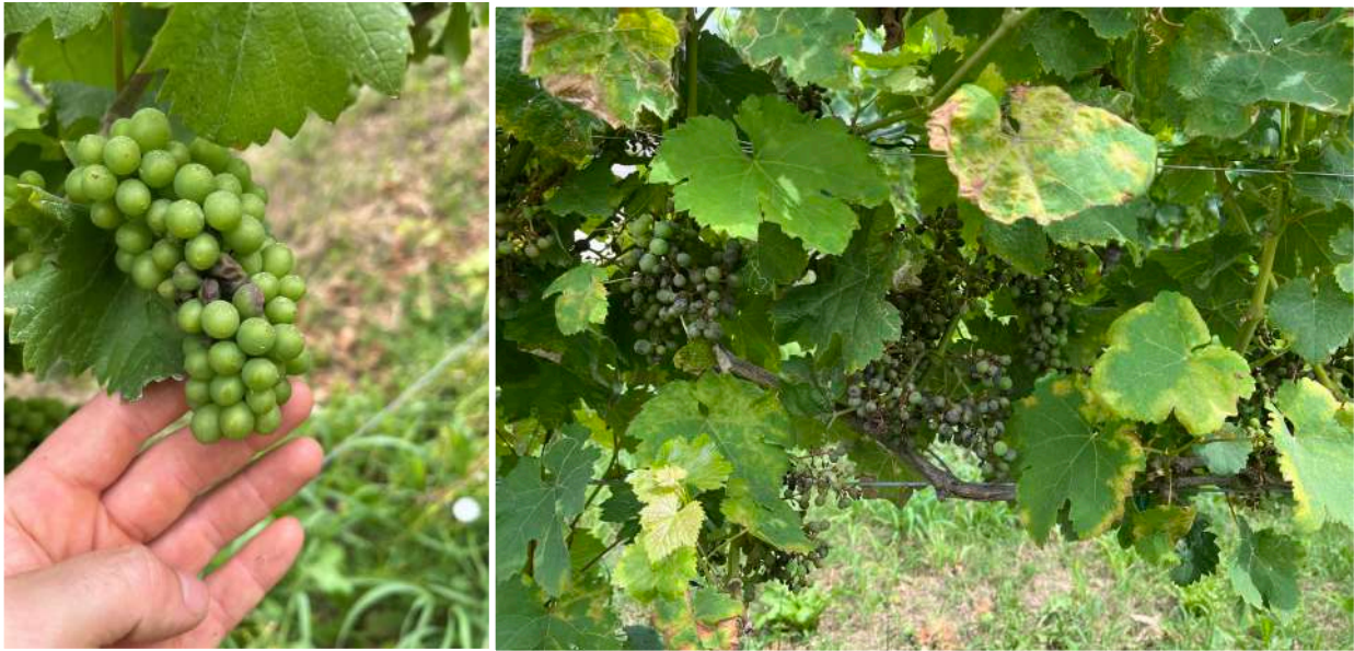
A sinistra peronospora larvata su chardonnay, a destra forte attacco di larvata che ha attaccato la totalità dei grappoli di una pianta. Foto scattate il 1-7-2024

probabilità di precipitazione si consiglia di utilizzare prodotti autorizzati in biologico additivati di adesivante per migliorare la persistenza del prodotto oppure adesivanti biologici a base di Pinolene. Possono essere utilizzati in abbinamento al rame prodotti a base di Cerevisane che espletano un'azione sistemica come induttori di resistenza.