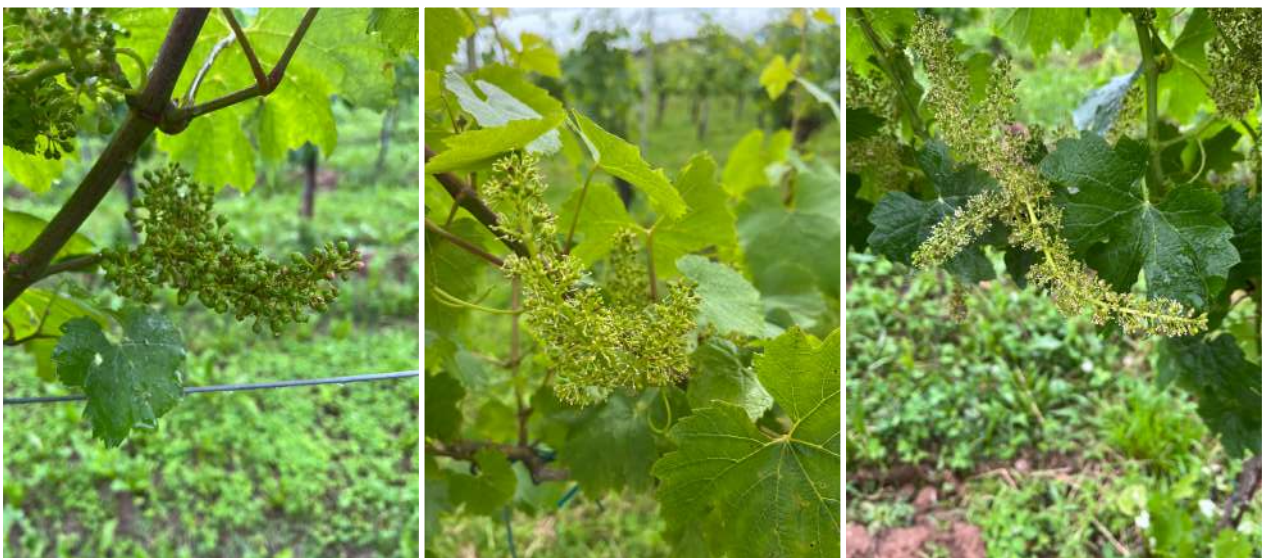
A sinistra Chardonnay a Castelli Calepio con acini grano di pepe, in centro chardonnay a fine fioritura a Scanzorosciate. A destra Merlot a Chiuduno a fine fioritura.

Cultivar tardive (Cabernet S.) inizio fioritura (BBCH 61)