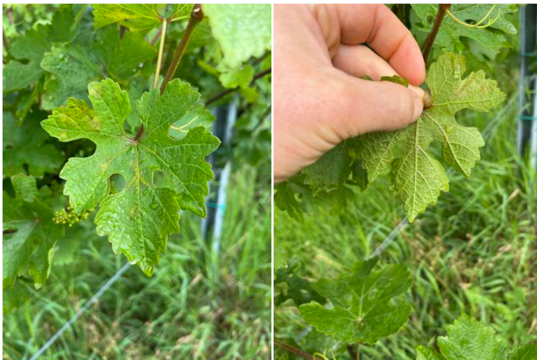
Lesione di peronospora. A sinistra i tipici sintomi di cicli secondari di malattia con macchia d'olio diffuse su tutta foglia. A destra la pagina inferiore della stessa fogliadove si intravedono le prime sporulazioni. Chiuduno, mattina di lunedì 3 giugno.

Consorzio ai sensi art. 19 Legge 164/92 Disciplinare D.M. 2/8/93 – G.U 26/8/93 n. 200