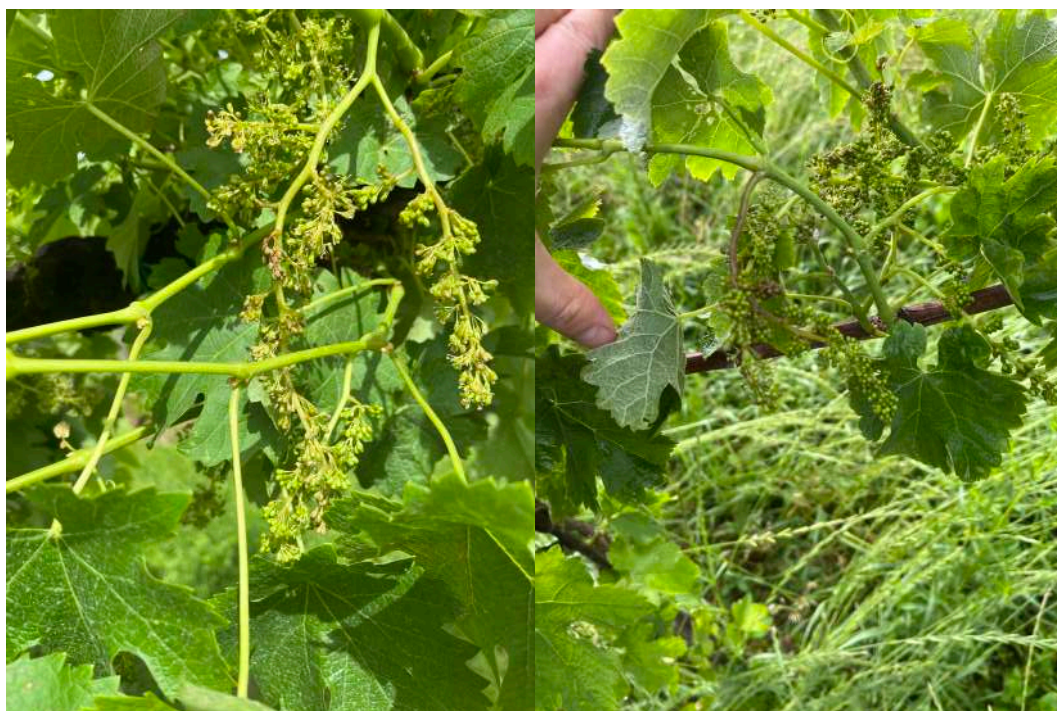
A sinistra Grappolo di Merlot con racimolo probabilmente colpito da peronospora (Torre de Roveri). A Destra grappolo colpito da peronospora (Chiuduno). È evidente il tipico imbrunimento e l'assunzione della tipica forma a S. Foto scattate nella mattina di lunedì 3 giugno.