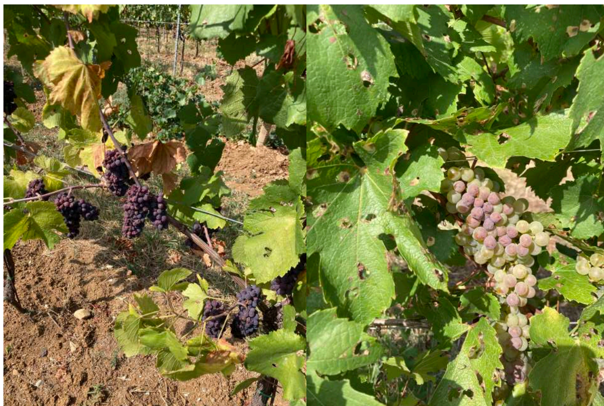
A sinistra Pinot grigio, a destra chardonnay fotografati a Scanzorosciate il giorno 8 Agosto 2022. Si notano i danni da scottatura.

Nelle prime ore di oggi, martedì 9 agosto, si è verificata una abbondante pioggia nella zona centrale della bergamasca, con accumuli di pioggia attorno ai 30-35mm. Questa precipitazione, essendosi verificata nella giornata di oggi verrà riportata nel prossimo bollettino. Le temperature elevatissime (3 giorni oltre 37°C di massima) riscontrate nella scorsa settimana hanno generato notevoli scottature a danno dei grappolo, con danni piuttosto evidenti.