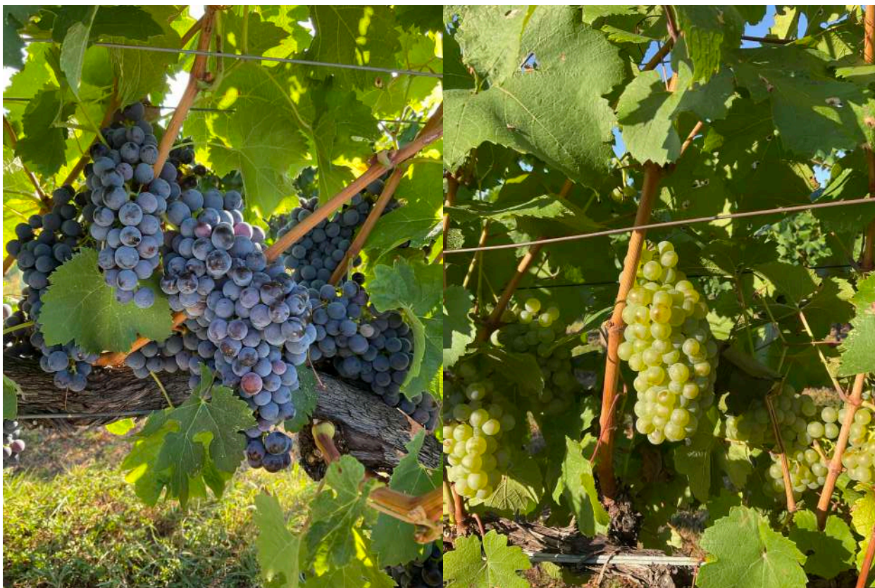
A sinistra Merlot e a destra Chardonnay ad Almenno San Salvatore, l'invaiaitura sta procedendo, nelle zone dove non si registrano alti livelli di stress idrico, in modo spedito. Foto scattate il 1° agosto 2022

Consorzio ai sensi art. 19 Legge 164/92 Disciplinare D.M. 2/8/93 – G.U 26/8/93 n. 200