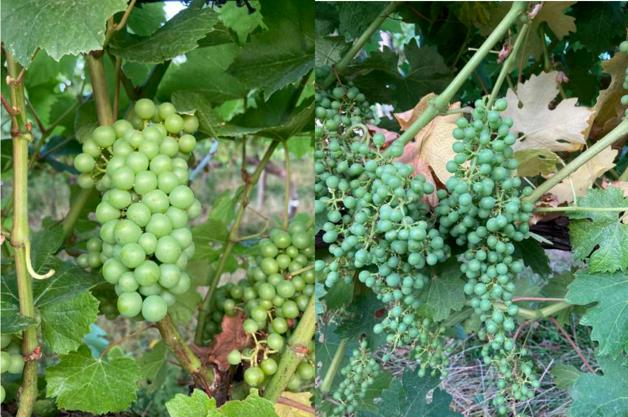
A sinistra Chardonnay, a destra Cabernet Sauvignon fotografati ieri ad Almenno San Salvatore

Cultivar medio-tardive (Merlot, Cabernet S.) Acino della dimensione di un pisello - pre chiusura grappolo (BBCH 75-77) nelle esposizioni migliori Merlot con grappolo chiuso (BBCH 79)